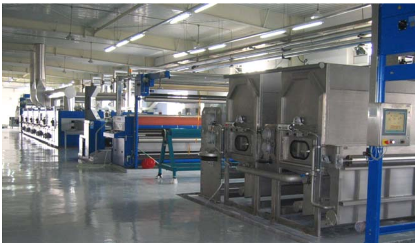
Abb. 1: Blick in die Produktionshalle bei Swisstulle (Qingdao), China

Diese Anlage zur Herstellung von qualitativ hochwertigen und schadstofffreien Gewirken aus Natur-, Synthetik- und High-tech Fasern besteht aus zwei Hauptkomponenten. Dies ist zum einen die effizient und äußerst spannungsarm arbeitende Waschmaschine SCOUT von Erbatech zur Avivagenwäsche. Bei gebundener Warenführung können mit dieser Maschine optimale Krumpfwerte erzielt werden. Die zweite Komponente ist ein Hochleistungsspannrahmen POWER-FRAME von Brückner zum Trocknen und absolut gleichmäßigen Fixieren. Durch die energiesparenden und umweltfreundlichen Komponenten der kompletten Anlage konnten Brückner und Erbatech bei Swisstulle überzeugen. Gleichzeitig profitiert der Kunde von einer höheren Produktionsleistung bei verbesserter Qualität.